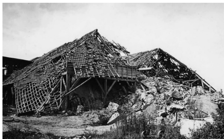
Ruïne De Korevaar 1945.

De tekst op het gedenkteken luidt: 'TO COMMEMORATE THOSE MEN OF THE 7TH BATTALION THE HAMPSHIRE REGIMENT WHO GAVE THEIR LIVES FOR THE CAUSE OF FREEDOM IN THIS AREA FROM 23RD SEPT. 1944 TO 4TH OCT. 1944'.