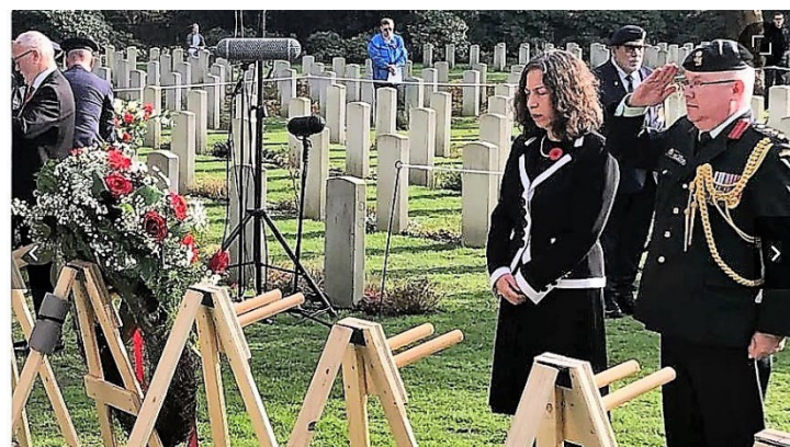
Ambassadeur met attache van Canada