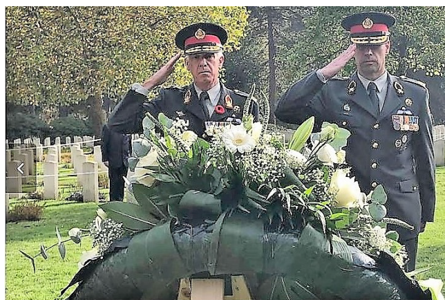
Nederlandse krijgsmacht legt een krans