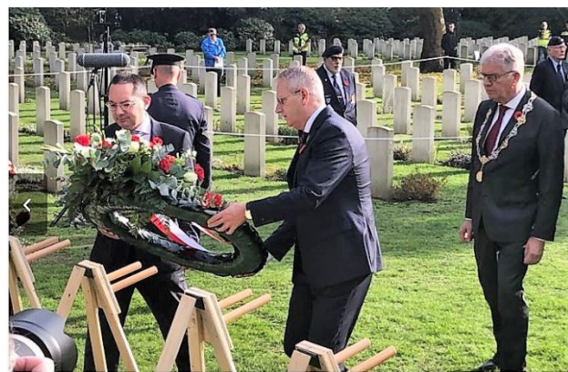
Burgemeesters Brabantse Wal