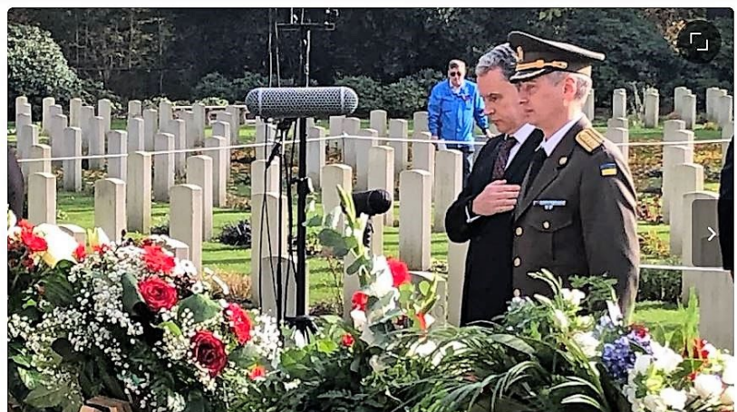
De vertegenwoordigers van Oekraïne

RCL Branch 005 was er bij met de Colour Party en een delegatie. Ook zij legden een krans.