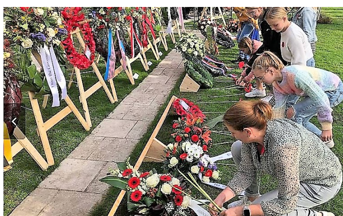
Bloemen van scholieren